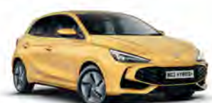
ŻÓŁTY „PASTEL YELLOW” (standard)

* Lakiery trójwarstwowe i metaliczne dostępne za dodatkową opłatą.