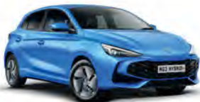
NIEBIESKI „COMO BLUE” (metalik)

Przygotuj się na to, że będziesz przyciągać uwagę.