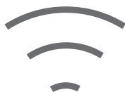
Aplikacja MG iSMART

Płynna jazda, inteligentna konstrukcja, niskie koszty eksploatacji, energetyzujący wygląd – wszystko to zapewnia niesamowite doznania.