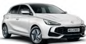
BIAŁY „DOVER WHITE” (standard)