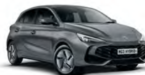
SZARY „HAMPSTEAD GREY” (metalik)