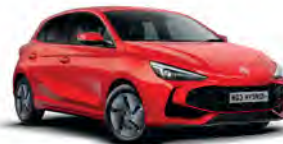
CZERWONY „DIAMOND RED” (trójwarstwowy)