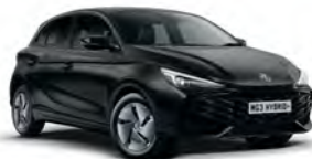
CZARNY „PEBBLE BLACK” (metalik)