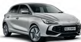
SREBRNY „COSMIC SILVER” (metalik)