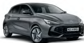
SZARY „HAMPSTEAD GREY” (metalik)