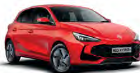
CZERWONY „DIAMOND RED” (trójwarstwowy)