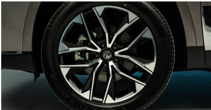
20" felgi aluminiowe