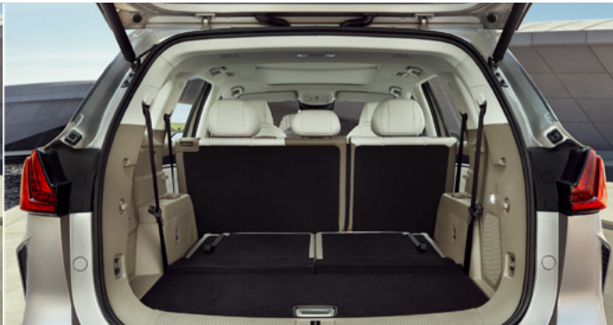
Pojemność bagażnika od podłogi do sufitu (3. rząd siedzeń złożony): 1 026 litrów