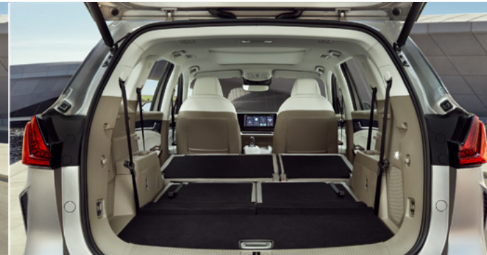
Pojemność bagażnika od podłogi do sufitu (2. i 3. rząd siedzeń złożony): 2 093 litry