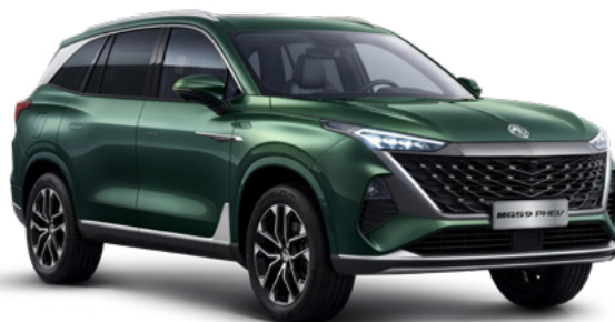
Gloucester Green (GDG) Lakier trójwarstwowy