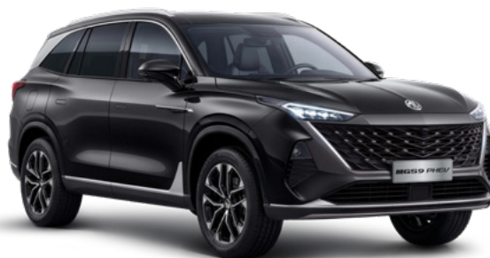
Pebble Black (PBC) Lakier metaliczny