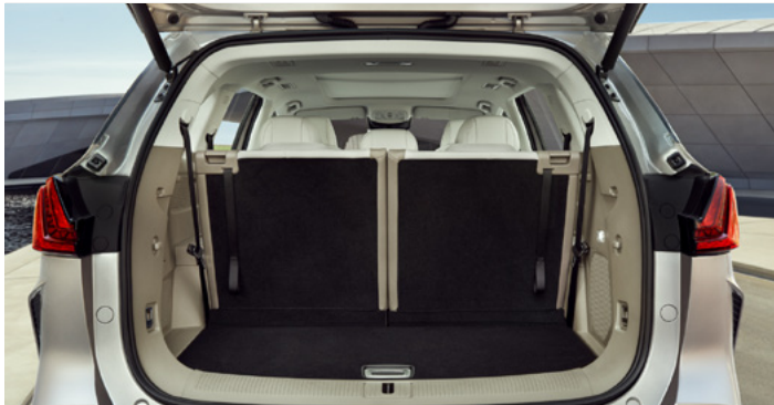
Pojemność bagażnika od podłogi do sufitu (3. rząd siedzeń podniesiony): 332 litrów