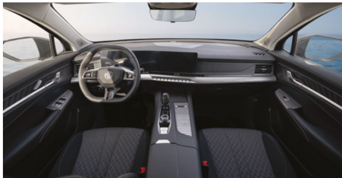
Tapicerka materiałowa (czarno szara)