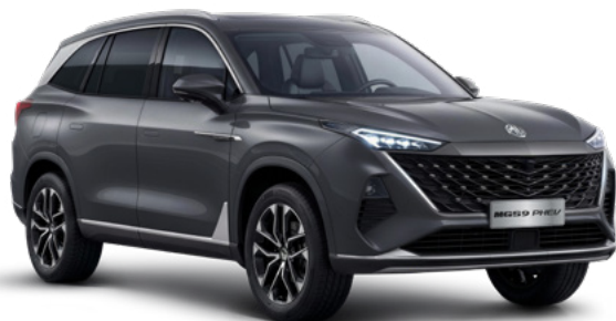
Andes Grey (PAG) Lakier metaliczny