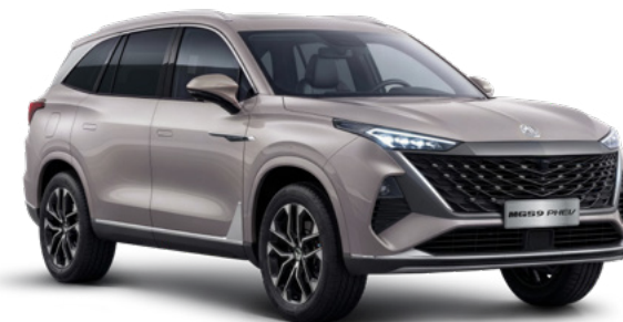
Sterling Silver (DCM) Lakier metaliczny