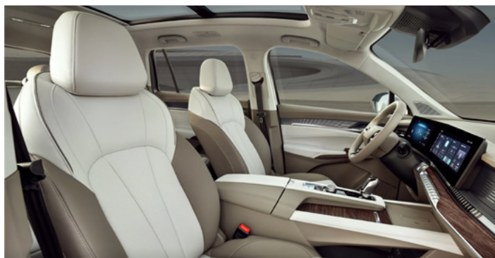
Tapicerka w stylu skórzanym (brązowo-beżowa) (połączenie dwóch odcieni plus dekory drewnopodobne)