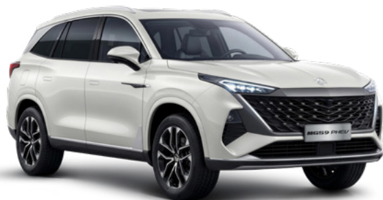
Oxford White (WSE) Lakier standardowy