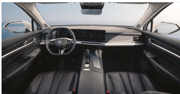
Tapicerka w stylu skórzanym (czarna)