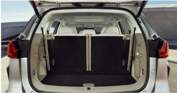
Pojemność bagażnika od podłogi do sufitu (3. rząd siedzeń podniesiony): 332 litrów