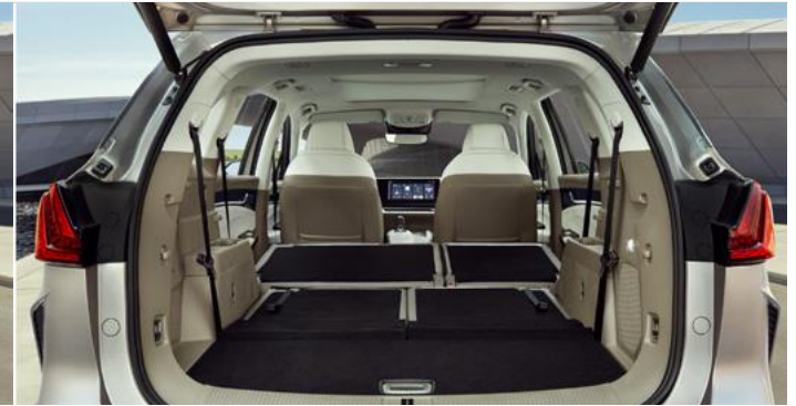
Pojemność bagażnika od podłogi do sufitu (2. i 3. rząd siedzeń złożony): 2 093 litry