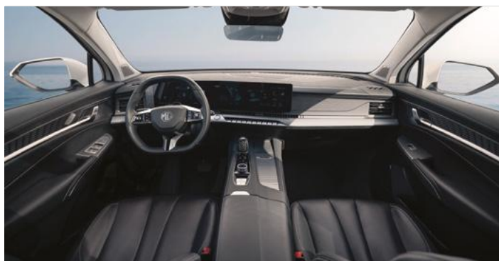
Tapicerka w stylu skórzanym (czarna)