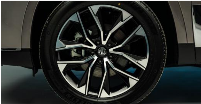
20" felgi aluminiowe