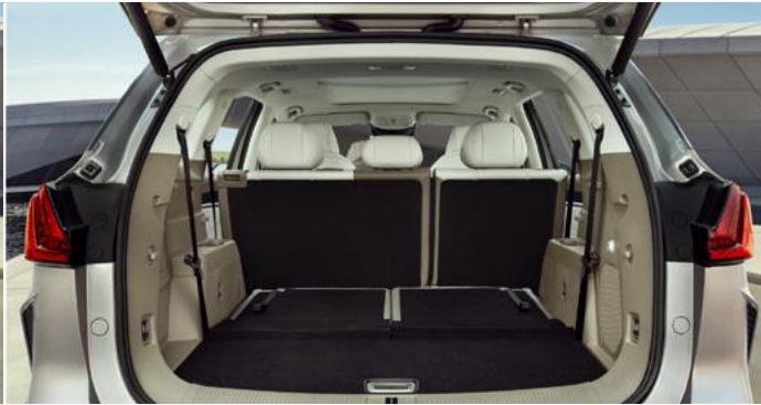
Pojemność bagażnika od podłogi do sufitu (3. rząd siedzeń złożony): 1 026 litrów