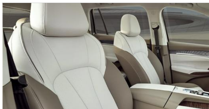
Tapicerka w stylu skórzanym (brązowo-beżowa) (połączenie dwóch odcieni plus dekory drewnopodobne)